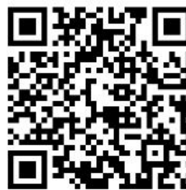
容缺事项办理清单